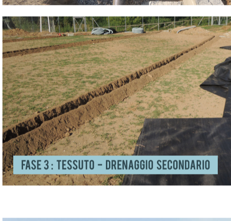
FASE 3: TESSUTO - DRENAGGIO SECONDARIO