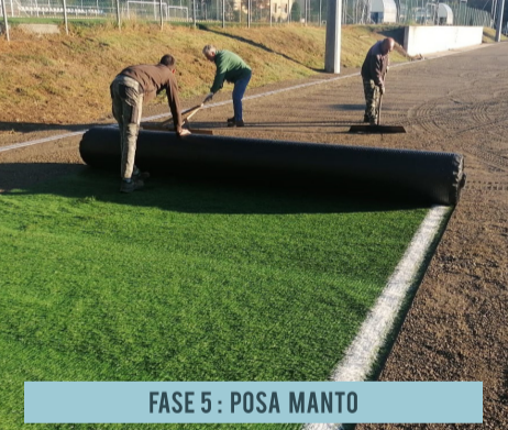
FASE 5: POSA MANTO