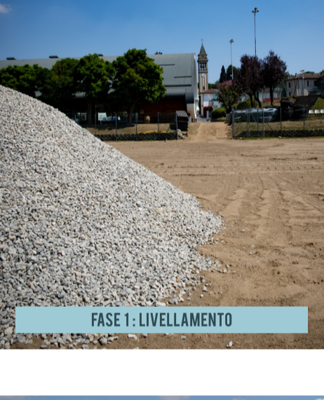
FASE 1: LIVELLAMENTO