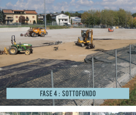
FASE 4: SOTTOFONDO