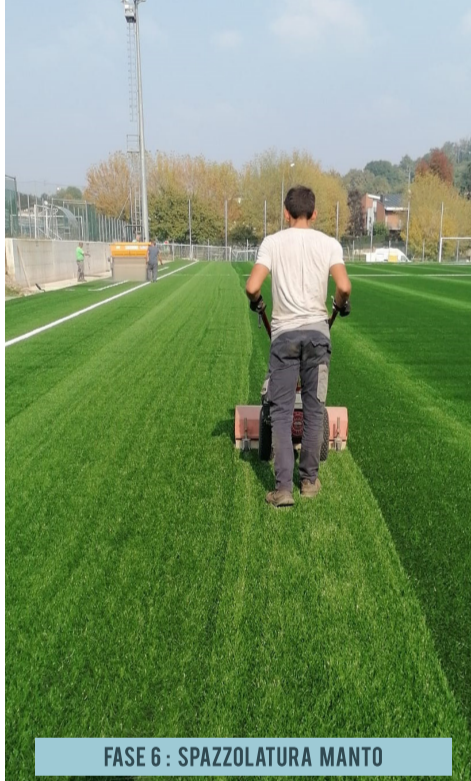
FASE 6: SPAZZOLATURA MANTO